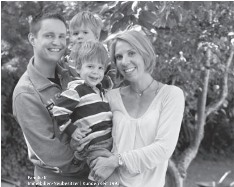
Familie K. Immobilien-Neubesitzer | Kunden seit 1993