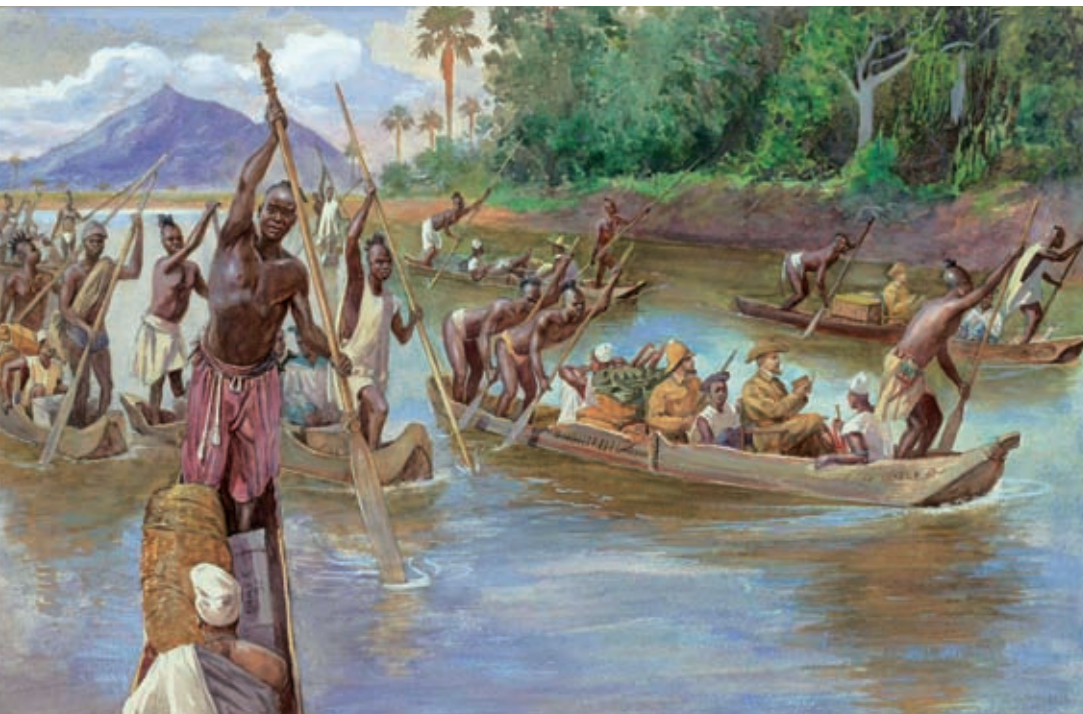
Im Jahre 1910 fuhren Frobenius und seine Expedition auf Einbäumen den Benue-Fluss in Nigeria hinab. Am Oberlauf des Flusses hatte er zuvor mehrere Monate lang die kaum bekannten ethnischen Gruppen Adamas besucht, ihre Kultur und Architektur dokumentiert und ihre Märchen aufgeschrieben. Im Herbst 2010 werden die damals entstandenen Fotografien, Aquarelle und Zeichnungen erstmalig in Nigeria ausgestellt.

vermeintlich ursprüngliche und im Verschwinden begriffene Welt sollte durch Fotografien, Zeichnungen und Aquarelle für die Nachwelt dokumentiert werden.